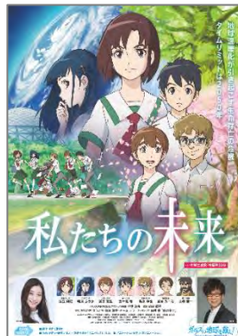
B1 B2 ※絵柄共通