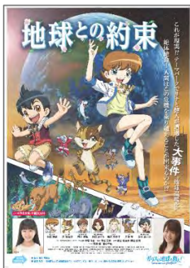
B1 B2 ※絵柄共通